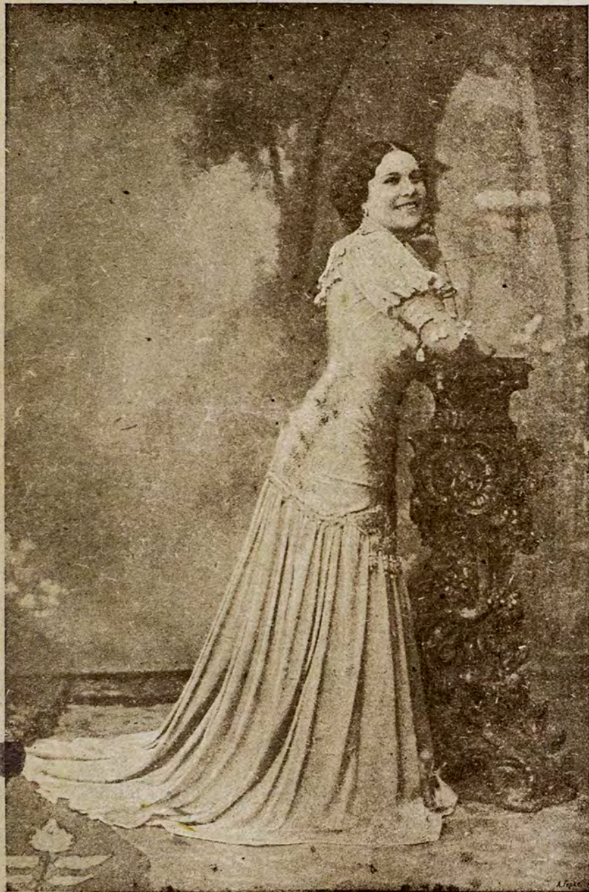
Н. В. ПЛЕВИЦКАЯ.