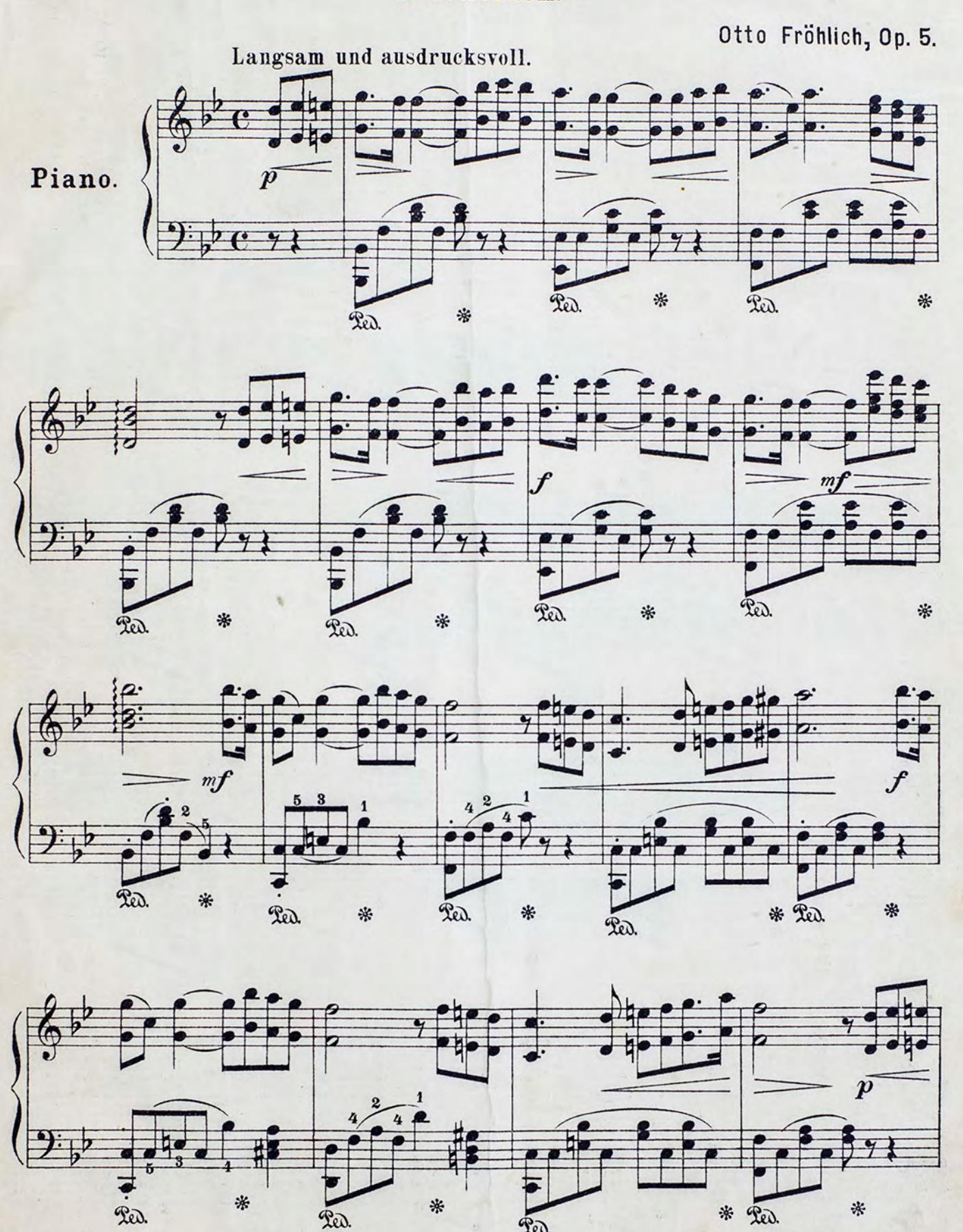
В. 888 І. Печатня В.Гроссе въ Москвъ. Б. Спасская ул. соб. д.