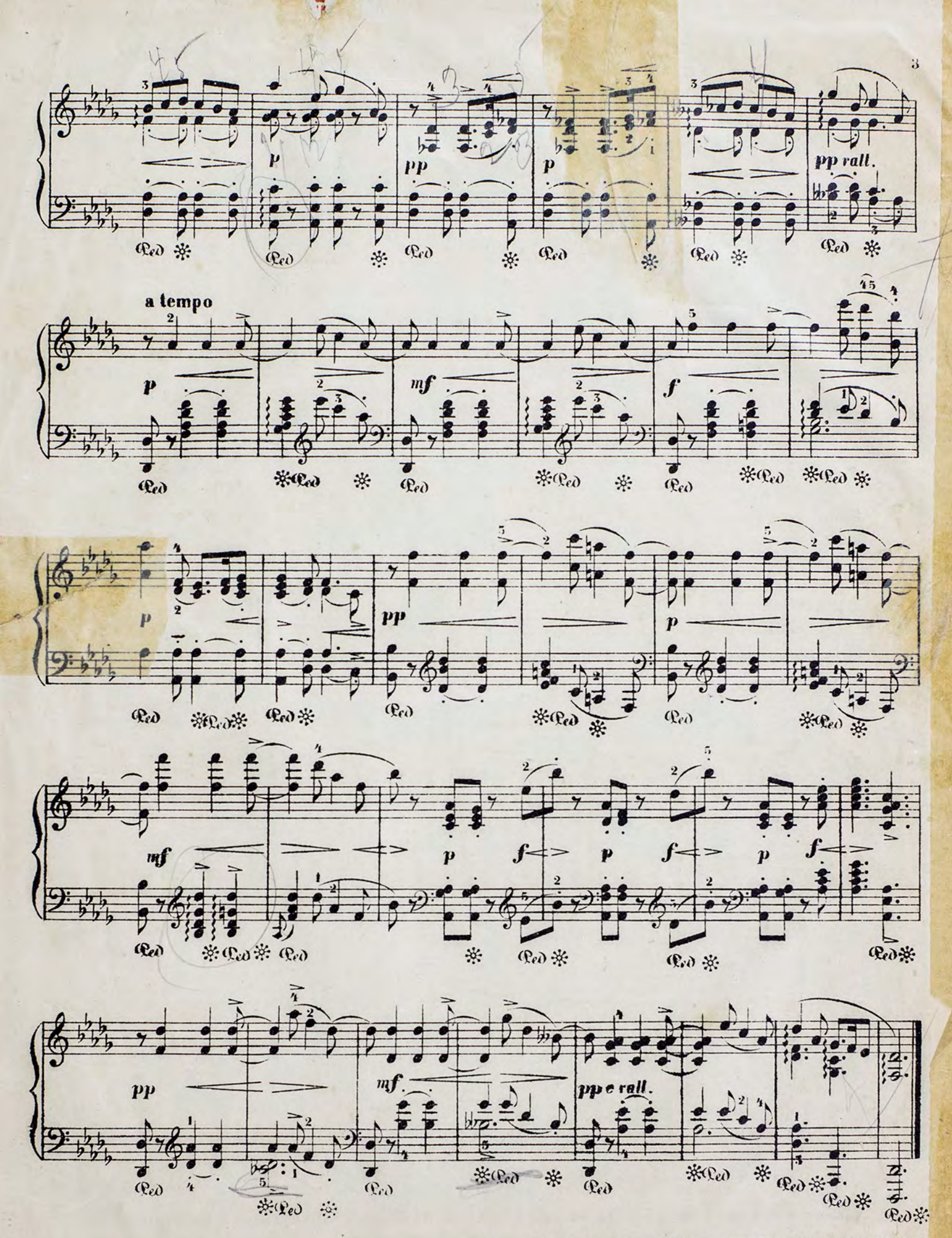
2319 Нотопечатия В. Бессель п К? Троиц. ул. N? 24.